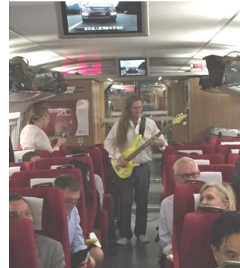
”Rocktågsdelegationen i 306 km/h”