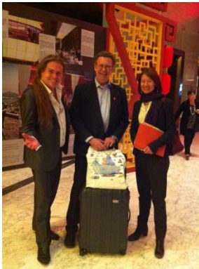
Generalkonsuln i Shanghai

I Shanghai blev det både tid över för middag och för sightseeing.